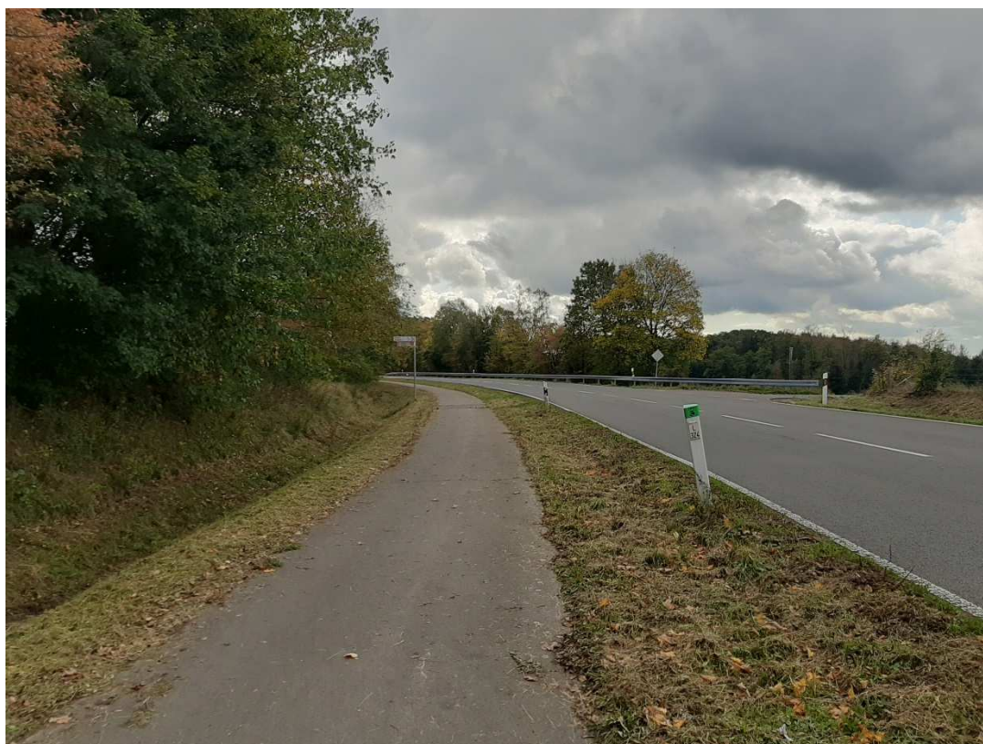
1. Radwegführung über die L 324 in Höhe Ortschaft Heide